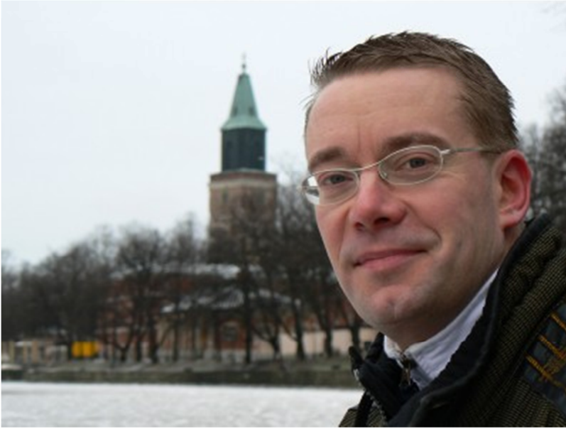
Stefan Wallin Puolustusministeri Puolustusministeriö